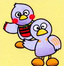
埼玉県マスコット 「さいたまっち&コバトン」